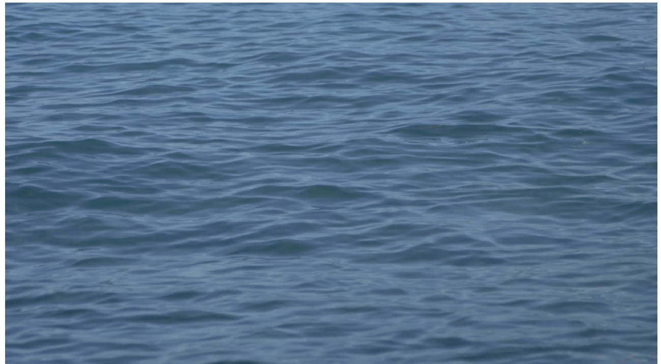
Monika Emmanuelle Kazi, Video still, 2022, Courtesy of the artist