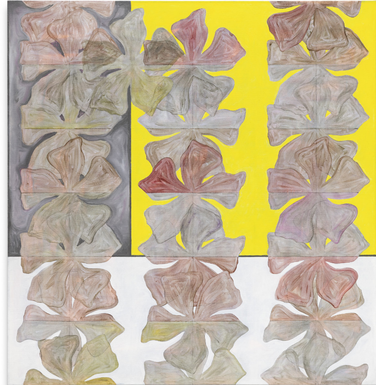
Nora Kapfer, Pythia I , Gouache, acryl, oil on linen, 150 x 144 cm, 2022