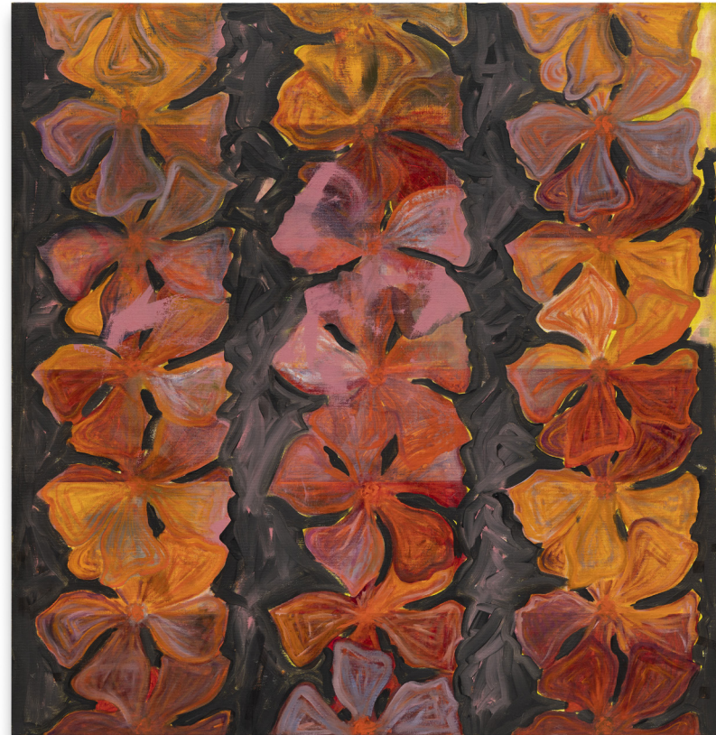
Nora Kapfer, Pythia II , Gouache and oil on linen 150 × 144 cm, 2022, photo Timo Ohler. Courtesy of the artist