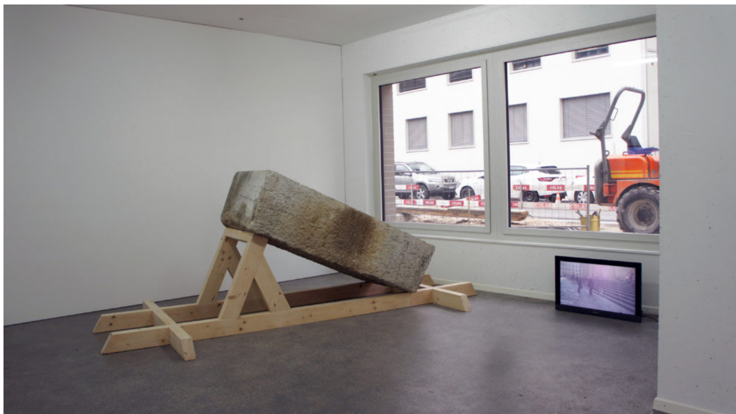
Collectif GALTA, vue de l'exposition Aujourd'hui pour oublier , Espace 3353, Carouge 2018