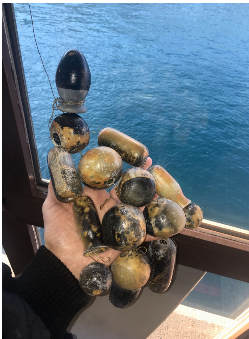
Camille Dumond, Plug ballad model 1 (recherche), 2020