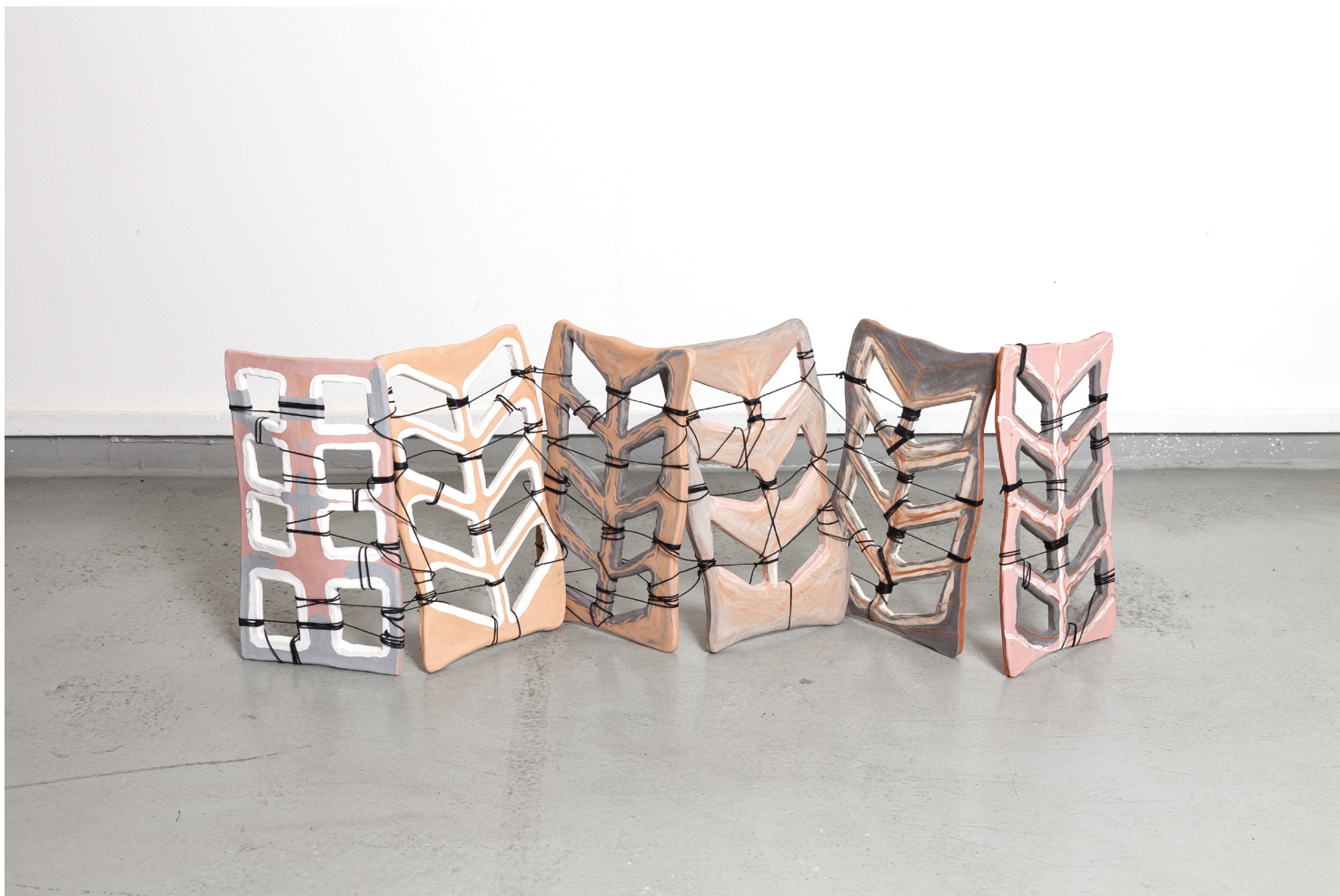
Camille Dumond, Haro + readings , Quark, Genève, 2019