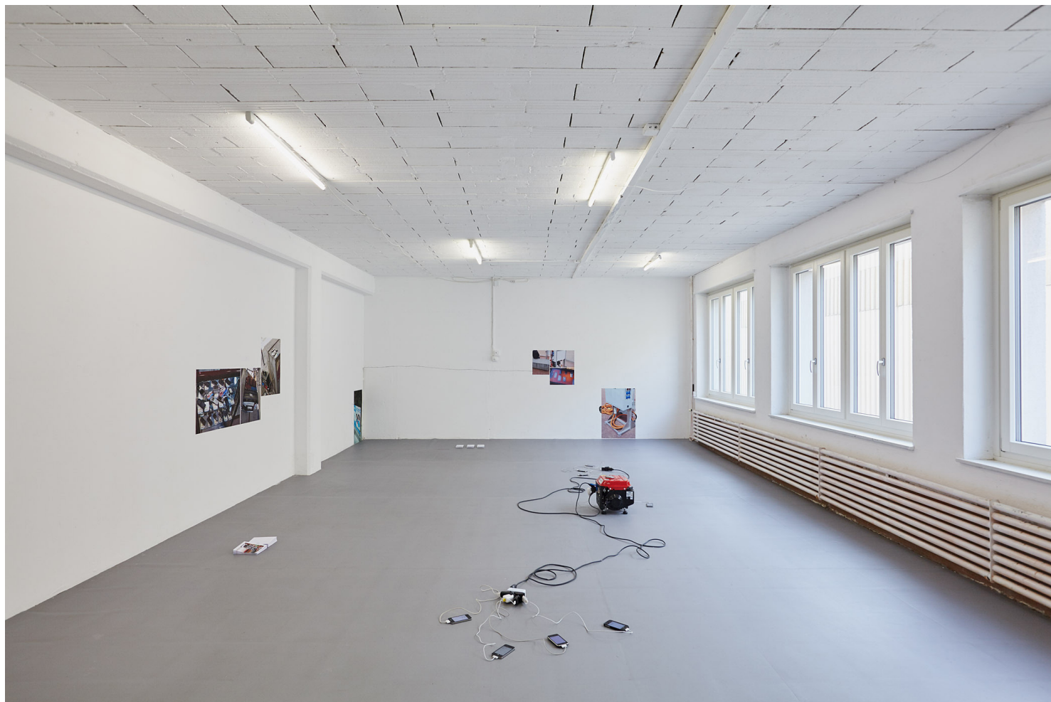
Camille Kaiser, I don't like to be waiting doing nothing , Espace 1.1, Basel, 2018