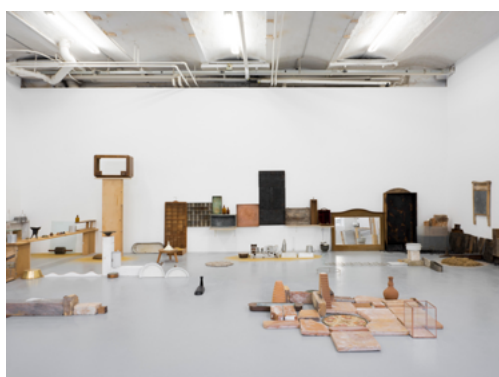
Youssef Limoud, Elements of the void , 2022, CAN Centre d'art Neuchâtel.