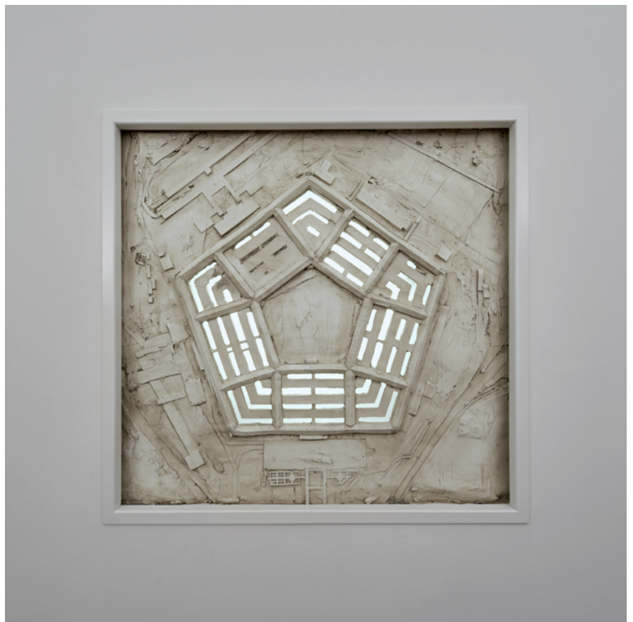
Yannic Joray, The Elect , 2021, Stadtgalerie, Bern.

2020 Grand Miniature , Sentiment, Zurich 2020 Sommer des Zögerns , Kunsthalle Zurich 2018 Lampen , Francesca Pia, Zurich 2018 Sancho Panza , Oracle, Berlin (DE) 2017 Hütte , Ludlow 38, New York (USA) 2017 Zur Rebschänke , Weiss Falk, Basel 2015 Raw and Delirious , Kunsthalle Bern