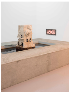
Lou Masduraud, Active substances fountain (détail) , 2018 CAN Centre d'art Neuchâtel.