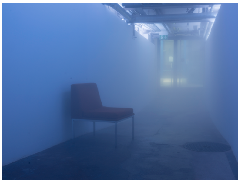
Barbezat-Villetard, l'Humeur , 2022. Vue de l'exposition Parallels Part 1: Astral Border .

The Barbezat-Villetard duo works in reference to places and situations. Using light, mirrors, fog and sculptural elements, they interfere with the architecture and logic of existing buildings or spaces. Their artistic interventions are, for example, ruptures, notches and materializations that modify the modalities of the context and thus our perception of spaces. Barbezat-Villetard shows us how spatial limits are broken down to create fictitious zones between the exhibition space and the public.