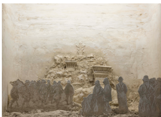
Yannic Joray, untitled yet , 2022