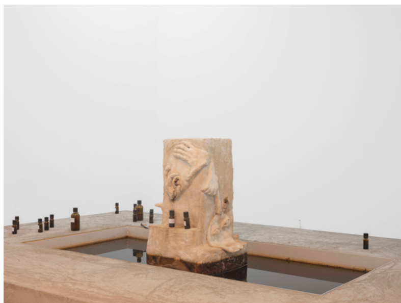
Lou Masduraud, Actives substances fountain , 2019, CAN Centre d'art Neuchâtel.

For the past few years, she has been working simultaneously on 3 projects: a critical research on public fountains, an evolving project of constrained anatomy, and Les plans d'évasions , a series of air vents.